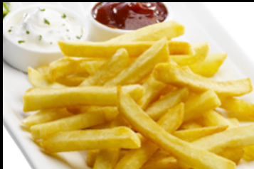
PATATAS STEAK 2.50